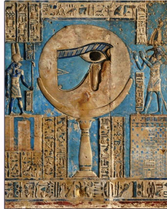
Création ADEC Laurence OLIVA | Temple de Denders