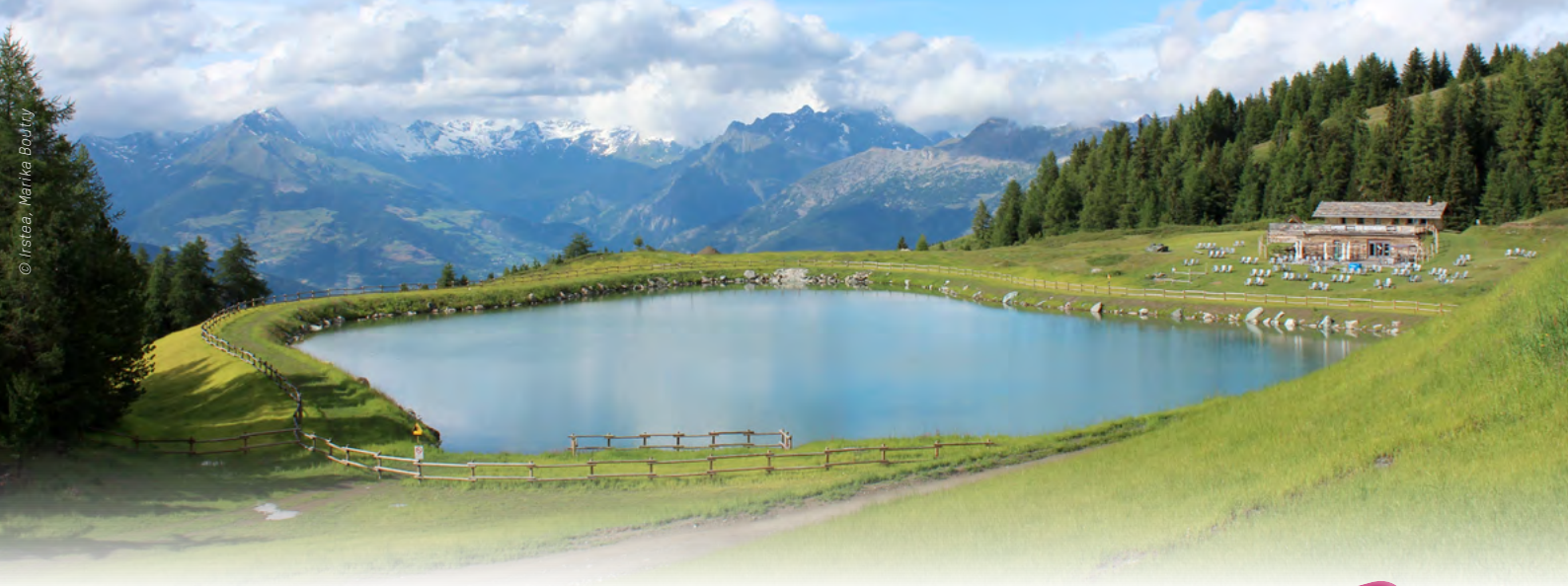
Retenue d'altitude dans les Alpes