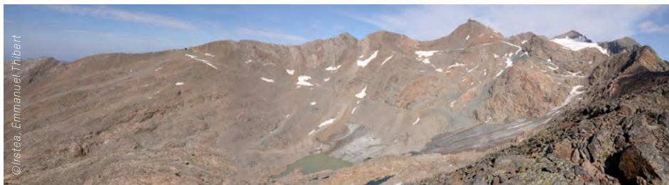
Le glacier de Sarenne (Alpe d'Huez) en 1906 et en 2016